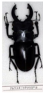
クワガタムシ科 アルケスオニツヤクワガタ