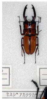
クワガタムシ科 セスジアカクワガタ