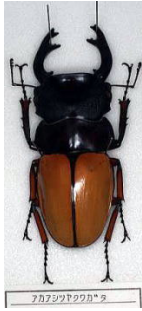
クワガタムシ科 アカアシツヤクワガタ