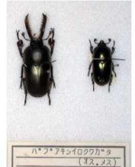
クワガタムシ科 バプアキンイロクワガタ (オス・メス)