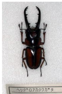
クワガタムシ科 ヘリグロアカクワガタ