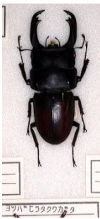
クワガタムシ科 ヨツバヒラタクワガタ