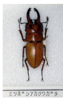
クワガタムシ科 ミツホシアカクワガタ