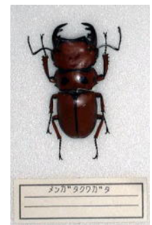
クワガタムシ科 メンガタクワガタ