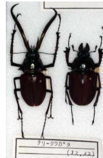
クワガタムシ科 チリークワガタ (オス・メス)