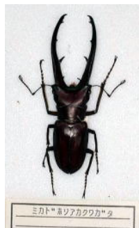
クワガタムシ科 ミカドホソアカクワガタ