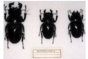
クワガタムシ科 クロツヤオオツノクワガタ