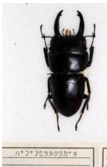
クワガタムシ科 バプアヒラタクワガタ