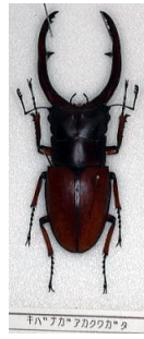
クワガタムシ科 キバナガアカクワガタ