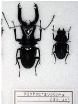
クワガタムシ科 クロツヤクビホソクワガタ (オス・メス)